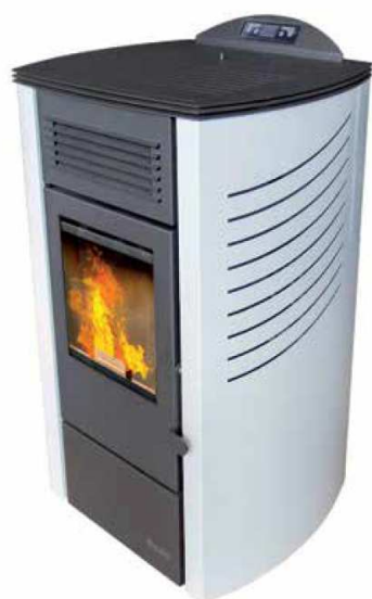
Salida de humos: posterior (T90)